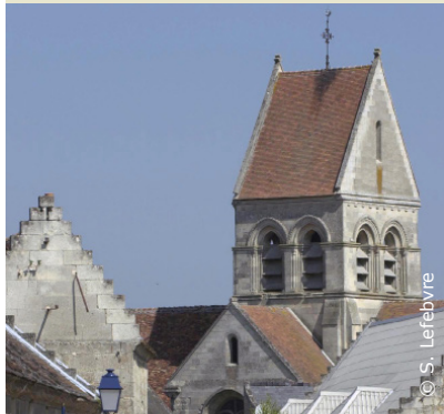
Église de Montigny-Lengrain